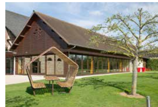
Le Manoir de la Chapelle, 1 route de Saint Colombe, La Chapelle Reanville, 27950 La Chapelle-Longueville

Ensemble, profitons d'instant de joie partagée pour que vive Saint-Marcel !