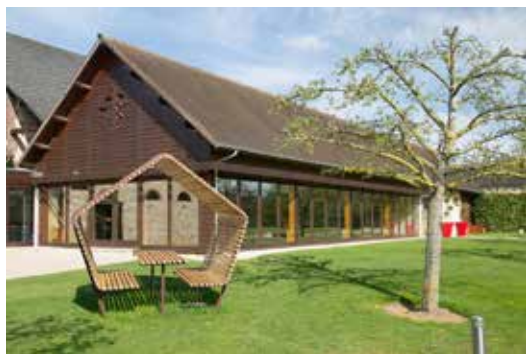
Le Manoir de la Chapelle, 1 route de Saint Colombe, La Chapelle Reanville, 27950 La Chapelle-Longueville

Ensemble, profitons d'instant de joie partagée pour que vive Saint-Marcel !